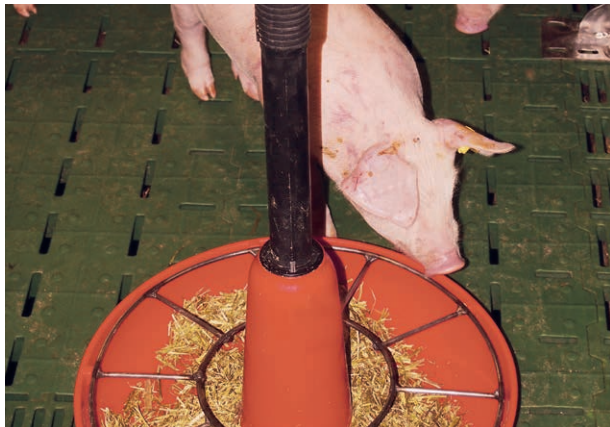
Beispiel für Raufuttergaben.

Die Gabe dieser Komponenten kann auch getrennt von der eigentlichen Fütterung als Raufuttergabe erfolgen. Hierbei haben die Tiere die Möglichkeit, selbst die Menge an Ballaststoffen zu steuern, die sie aufnehmen.